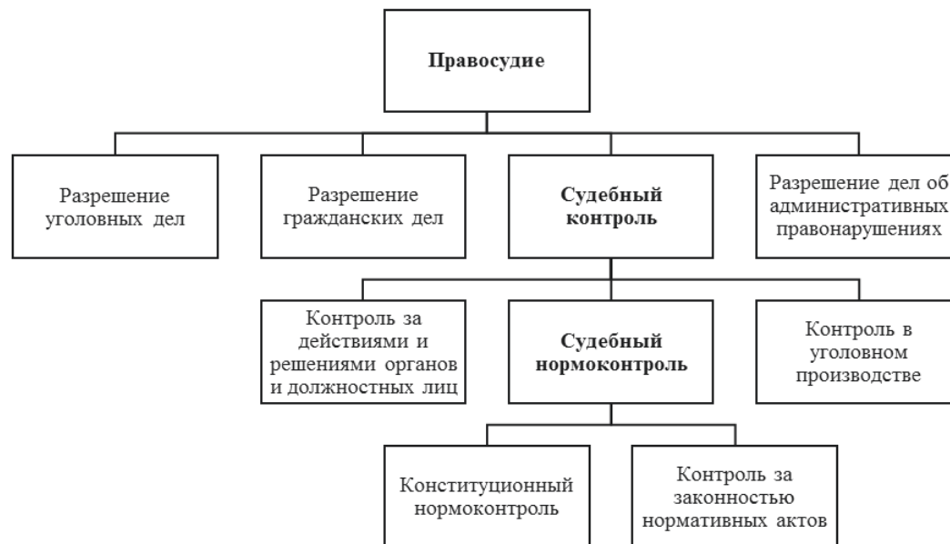
Рис. Место судебного нормоконтроля в системе функций судебной власти

ского, арбитражного, административного и уголовного;