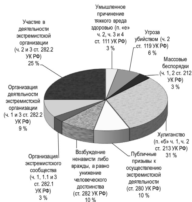
Рис. Структура экстремистской преступности иностранных граждан и лиц без гражданства в Российской Федерации в 2022 г.

анализ ст. 213 УК РФ 1 , предусматривающей ответственность за совершение хулиганских действий, поможет, на наш взгляд, более эффективно применить данную норму на практике, а, в свою очередь, грамотная правоприменительная практика будет положительным образом отражаться на общей превенции преступности в целом, на что в научной литературе неоднократно обращалось внимание правоведов [9, с. 423].