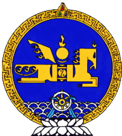
Рис. 1. Государственный герб Монголии

ворам, а побежденных противников щадили за проявленную доблесть и верность, предлагая им вступить в свое войско» [1, с. 78].