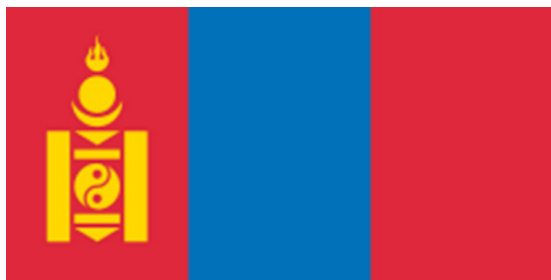
Рис. 2. Государственный флаг Монголии

Синий цвет в центре флага символизирует «вечное синее небо», а красный цвет по обеим сторонам – прогресс и процветание. Знак золотого соембо расположен на красной полосе на стороне древка. Отношение ширины флага к его длине – один к двум (п. 5 ст. 12 Конституции Монголии).