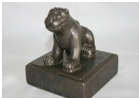
Рис. 3. Государственная печать Монголии

Во времена правления маньчжуров в Монголии государственной печати не было. Кроме того, сохранилась печать на бумаге (как оттиск), которая имеет почти восьмисотлетнюю историю. В мире очень мало стран, имеющих такую давнюю историю печати (имеется в виду история печатей вообще). Одним из наиболее старых артефактов является бумага с оттиском печати (письмо Гуюг хаана римскому папе), которая сейчас хранится во французском музее.