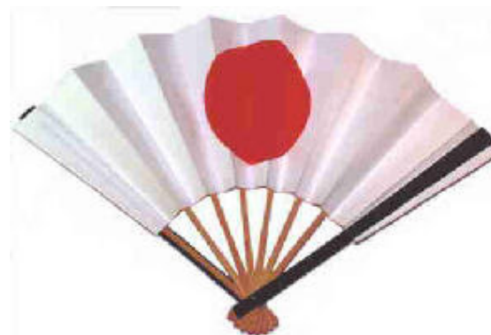
Рис. 4. Веер военачальника в период Хэйан

Считается, что военачальники ставили веера с изображением солнца на белом фоне позади своего войска, тем самым призывая силу солнца на свою сторону. Принятие хиномару в качестве официального символа страны связано, прежде всего, с отождествлением императора с солнцем [11]. Большое значение имеет сочетание цветов – алого и белого. В синтоизме алый цвет символизирует очистительную энергию огня и солнца. Кроме того, это цвет жизни. Белый цвет – цвет первозданной чистоты. Таким образом, сочетание алого и белого символизирует незапятнанную и счастливую жизнь, в достижении которой помогают синтоистские божества.