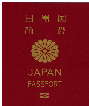
Рис. 2. Обложка заграничного паспорта японцев

В данном случае целесообразно поставить вопрос о существовании в Японии особого вида источников права, не имеющих признаков формальной определенности (по крайней мере, не всех признаков формальной определенности), а именно обычаев или традиций, санкционируемых государством посредством молчаливого признания. Сформулированную гипотезу отчасти подтверждают еще два государственных символа, получившие формальную определенность в виде нормативного правового акта, Закона о государственном флаге и государственном гимне, который был принят 13 августа 1999 г. Данный факт состоялся спустя более полувека после принятия действующей Конституции Японии. День принятия этого закона (13 августа) считается Днем государственного флага.